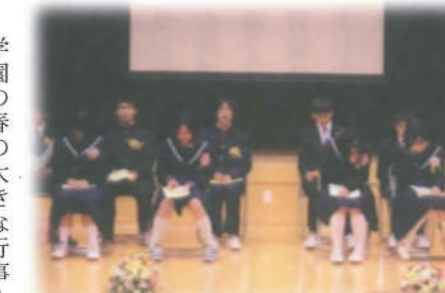
学園を巣立った9人

学園の春の大きな行事、巣立ちの会が三月二十日、多目的ホールで約百八十人が集まって開かれました。学園では様々な家庭の事情から百五十人の子どもたちが生活しています。入園したり退園するときはそれぞれ異なっていますが、中学校、高校などを卒業したり、学園の節目のこの三月は、学園を退園する節目の時となっています。