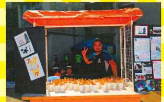
ファミリーホームくらちゃんハウスも協力していただきました。

青葉まつりは来場者約600人程訪れます。ボランティアさんも100名ほどの協力をいただきました