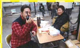
青葉友の会のボランティア本部もあって安心