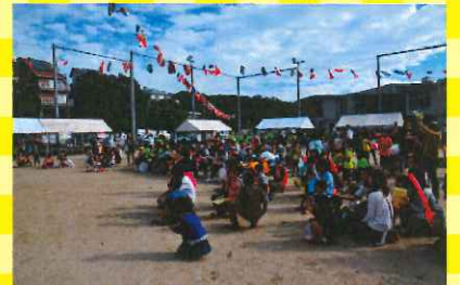
オープニングセレモニー！！