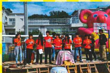
児童実行委員会です